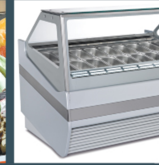
All RAL colors available Çok farklı renk alternatifleri