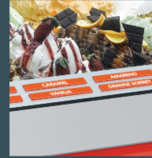
Your favorite flavor labels Size özel isimlikler