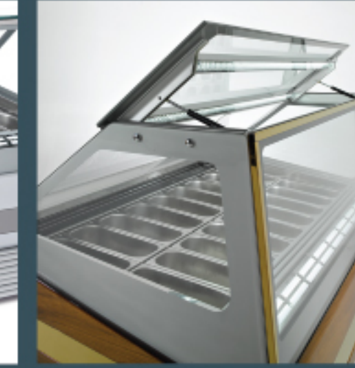
Hydraulic opening top window Hidrolikli açılır üst cam