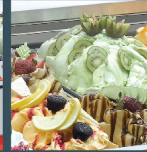
Your gelato in best condition Dondurmanız mükemmel durumda