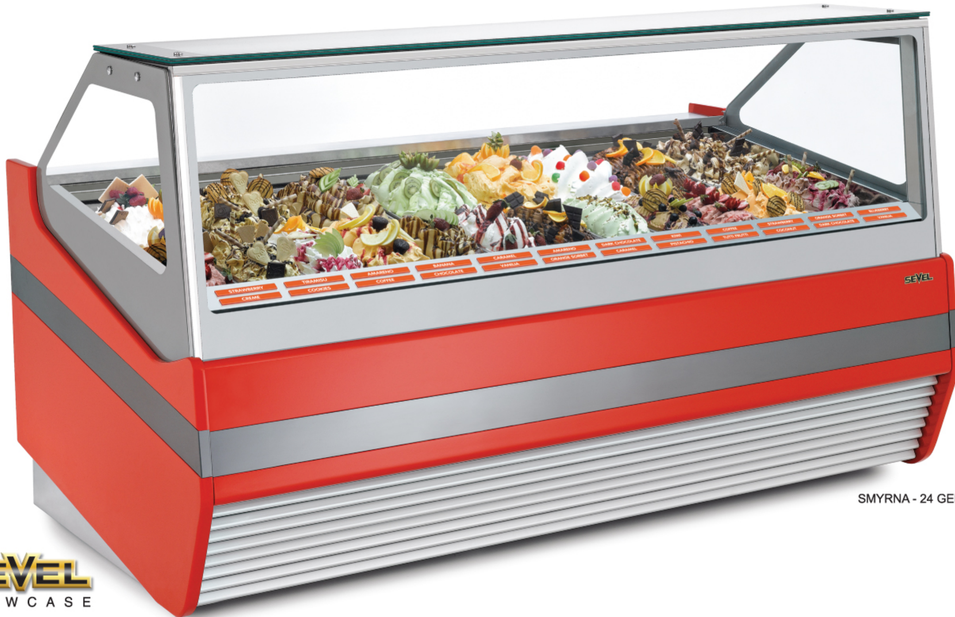
SMYRNA - 24 GELATO