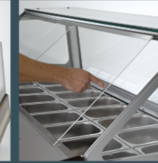
Plexi - sliding back doors Pleksi sürgülü arka kapaklar