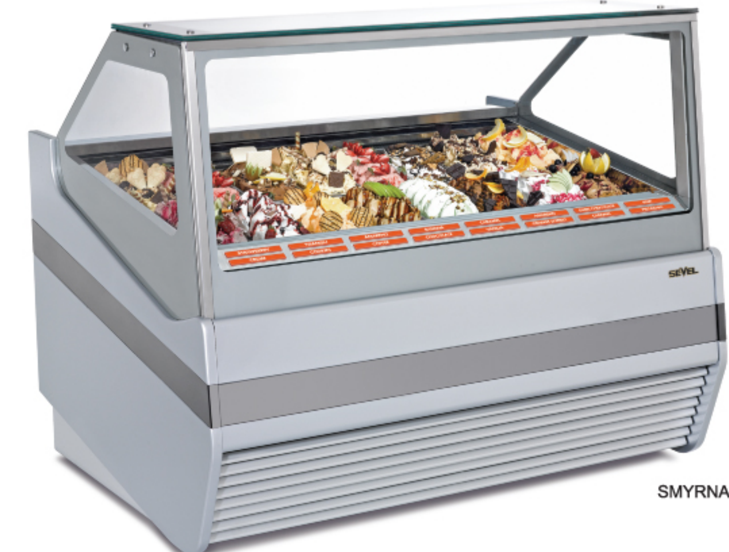
SMYRNA - 16 GELATO